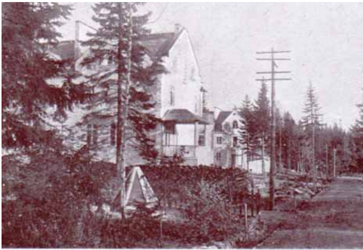
Ribbingshof. Radhus på Brändö. Vy från Glovågen.

kauppakirjaan sisällytetyillä kauppaehdoilla. Tontin ostaneet eli tonttien omistajat sitoutuivat maksamaan tietyn summan esim. Helsinkiin vievän sillan ja vesi- ja likaviemäripääjohtojen rakennuskustannuksista. Heidän velvollisuutensa oli huolehtia tontteihin rajoituvista teistä ja kaduista. Osakeyhtiö saattoi määrätä maksettavaksi myös koko huvila-alueita koskevia kustannuksia.