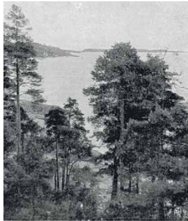
Utsikt öfver Kronbergssjön.